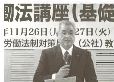
▲連合内田副事務局長