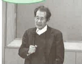
▲労働運動の歴史を学ぶ 講師：高木副校長