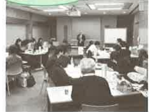
▲リーダーの経験談から学ぶ 講師：トヨタ自動車労働組合 東顧問 CN：高木副校長